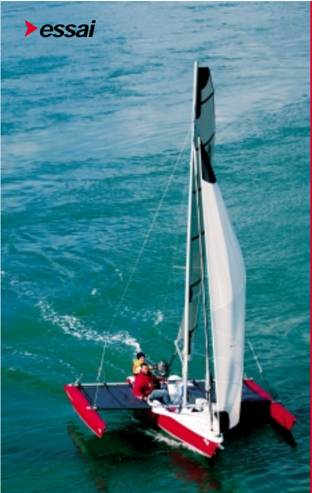
Un simple souffle d'air, et le Magnum 21 S s'élance...