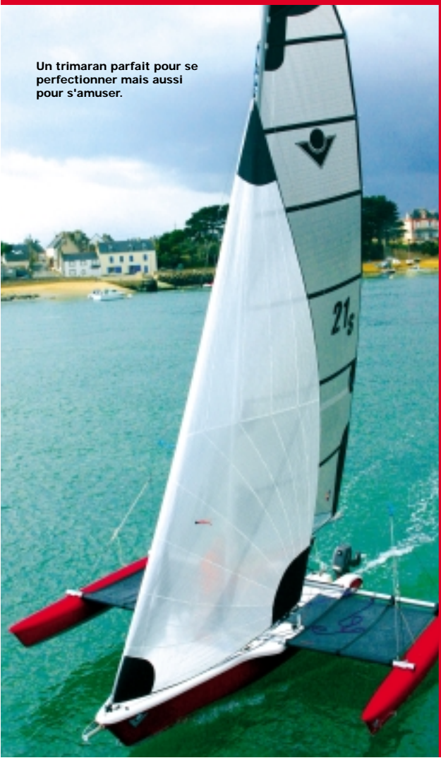
Un trimaran parfait pour se perfectionner mais aussi pour s'amuser.