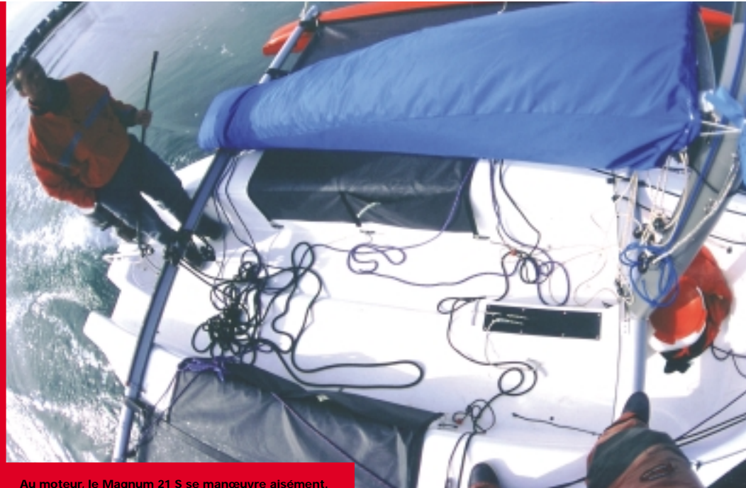
Au moteur, le Magnum 21 S se manœuvre aisément.