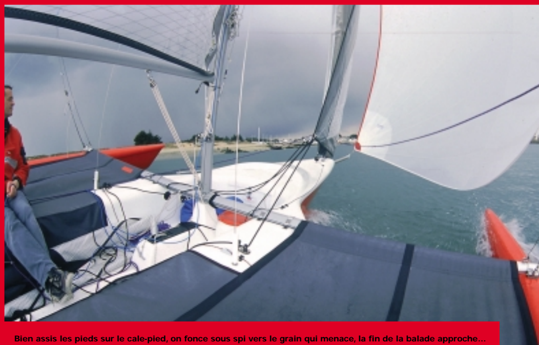
Bien assis les pieds sur le cale-pied, on fonce sous spi vers le grain qui menace, la fin de la balade approche...