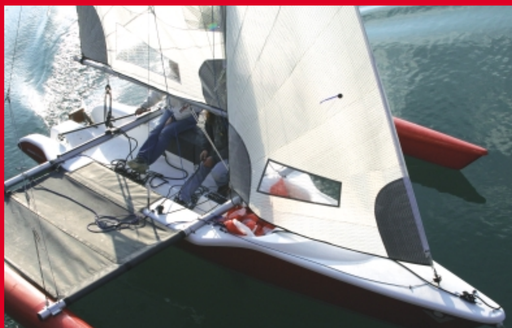
La plate-forme du tri offre un espace gigantesque et confortable.

fait la dérive en touchant les tables sous-marines... En réalité, il s'agit du clamceat mobile qui s'est soulevé sous le choc libérant ainsi le bout de la dérive ; le système est simple et efficace, un bon point de plus pour le Magnum.